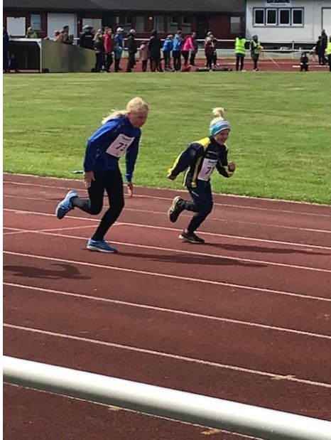
Fra T-A sprint/Moan-stevne 13.juni.