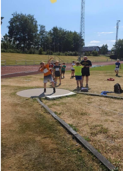
Kulekasting under friidrettsskolen.